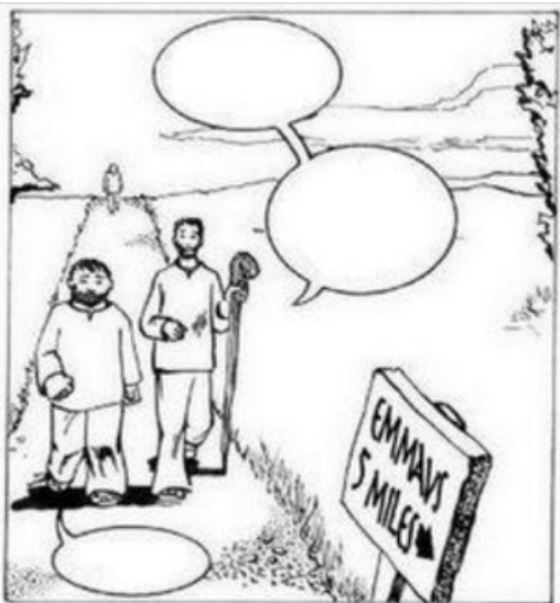
Het begin van de reis