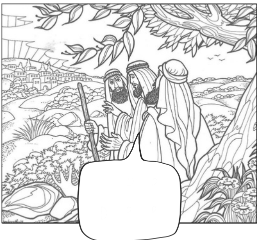
Jezus legt uit