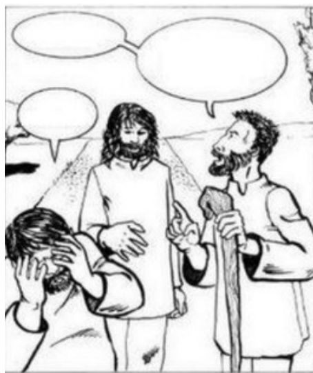
Jezus komt bij hen lopen